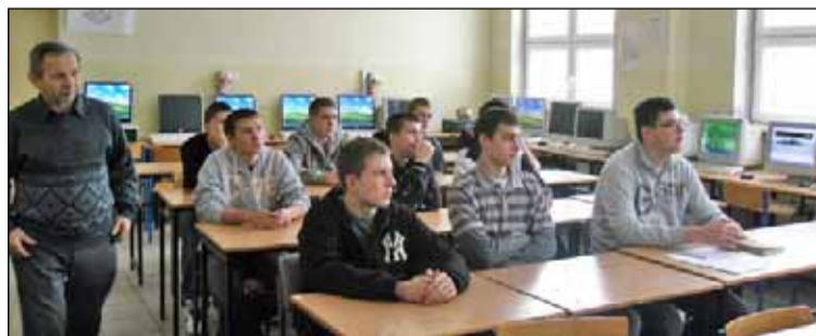
Uczestnicy kursu komputerowe wspomaganie projektowania CAD/CAM