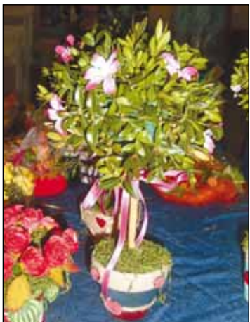
Centrum Integracji Społecznej