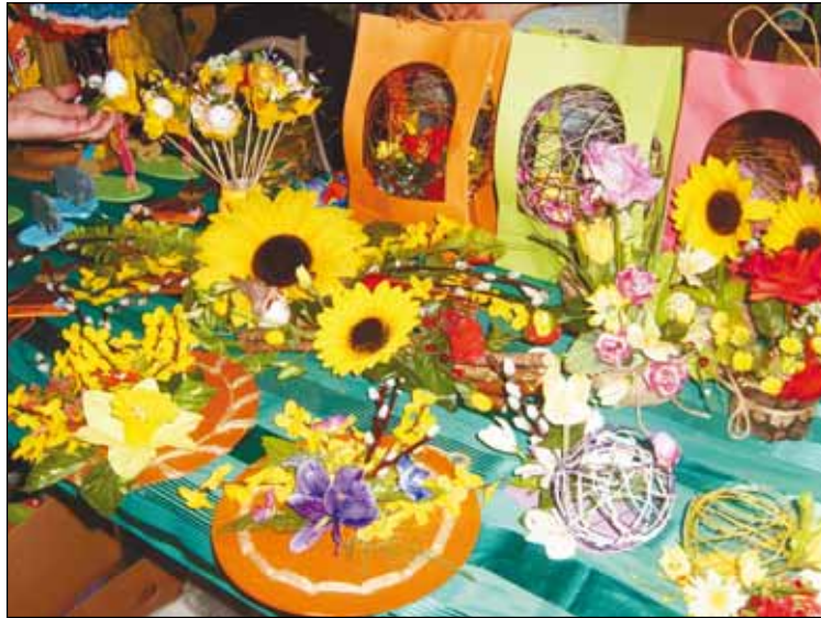
Od razu robi się słonecznie - DPS i ZSS w Kadłubie