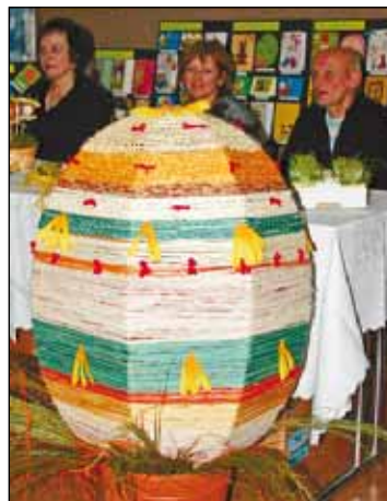
Ponadmetrowe jajo sznurkowe - DPS w Strzelcach Opolskich