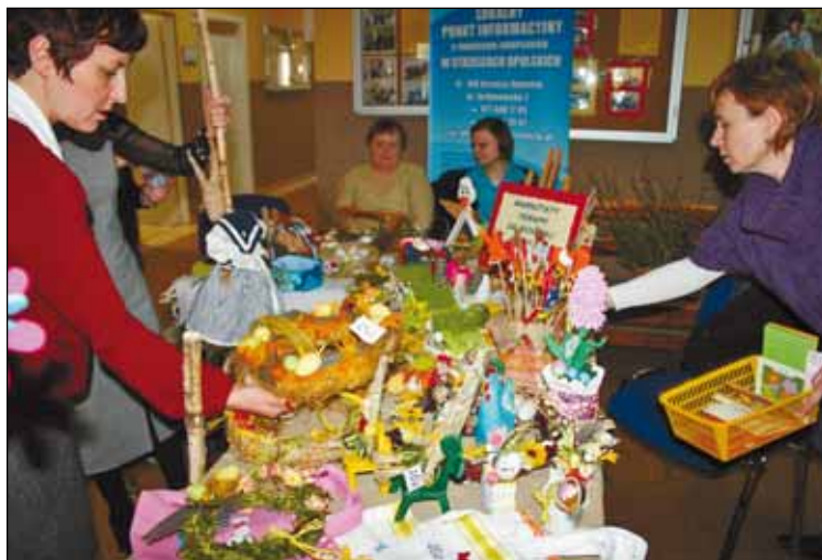
Po ozdoby z WTZ w Zawadzkiem wyciągało się wiele rąk