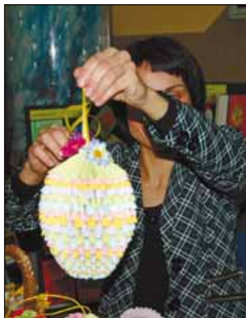
Jajo origami z ZSS w Zawadzkiem