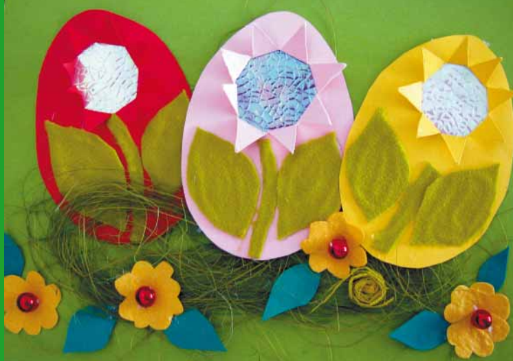
Kartka wykonana przez uczniów ZSS w Kadłubie

Przesyłam serdecznie pozdrowienia dla wszystkich mieszkańców Powiatu Strzeleckiego oraz życzę błogosławionych Świąt Wielkanocnych!