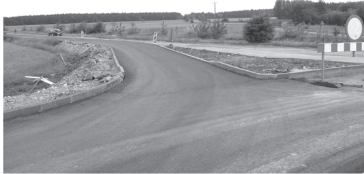
Promień łuku trzech wyjazdów z ronda zostanie powiększony