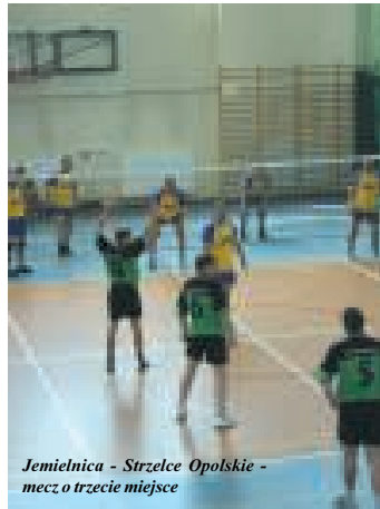
Jemielnica - Strzelce Opolskie - mecz o trzecie miejsce

Strzeleccy samorządowcy rozluźnili krawaty, zrzucili białe koszule i zamienili je na sportowe koszulki. Zamiast siedzieć za biurkiem, odbijali piłkę na siódmym już Turnieju Pracowników Samorządowych w Pilec Siatkowej.