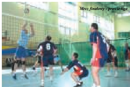
Mecz finałowy - prawie liga

zabrakło graczy w jakiejś drużynie, siatkarze z drużyny przeciwnej uzupełnili te luki i zasilili drużynę prze-