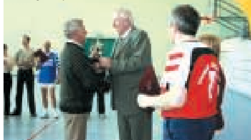
Kapitan zwycięskiej drużyny odbiera gratulacje