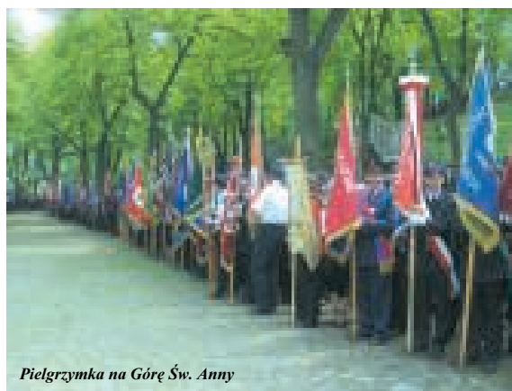
Pielgrzymka na Górę Św. Anny