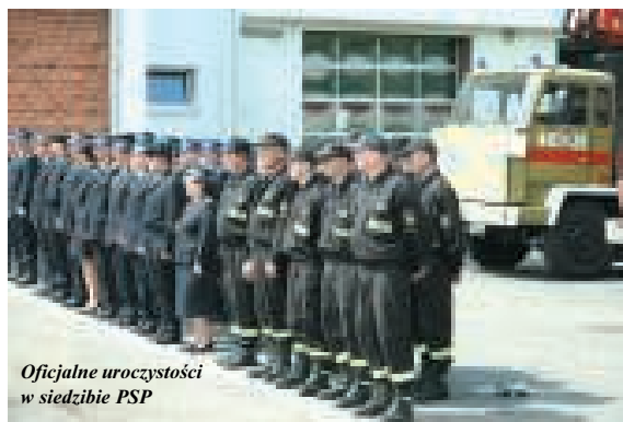
Oficjalne uroczystości w siedzibie PSP