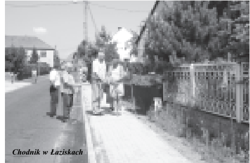
Chodnik w Łaziskach