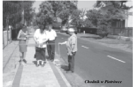
Chodnik w Piotrówce

Dwie inwestycje oddane do użytku 5 lipca: chodnik w Łaziskach ma 290 mb, w Piotrówce 280 mb. Razem obydwą kosztowały 124.295,94 zł. Koszty obu zadań mniej więcej rozkładają się po połowie.