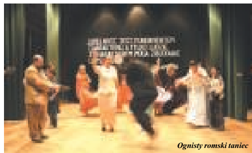
Ognisty romski taniec

Świętowanie miało bardzo uroczysty charakter. Pierwszą część uroczystości miała miejsce w sali widowiskowej Domu Kultury. Zaproszony chór „Sen” działający przy ZNP w Strzelcach Opolskich wyśpiewał miłość do Ojczyzny w pieśniach patriotycznych.