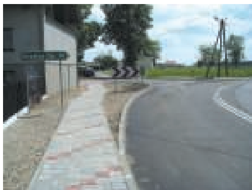
Nowy chodnik w Boryczy