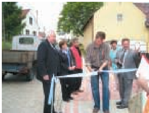
Oddanie chodnika w Starym Ujeździe

Początek czerwca obfitował w odbiory robót końcowych po budowlach bądź przebudowach ciągów chodnikowych. Pierwszego czerwca br. do użytku oddano, ku uciechu mieszkańców miejscowości Borycz, chodnik w ciągu drogi powiatowej