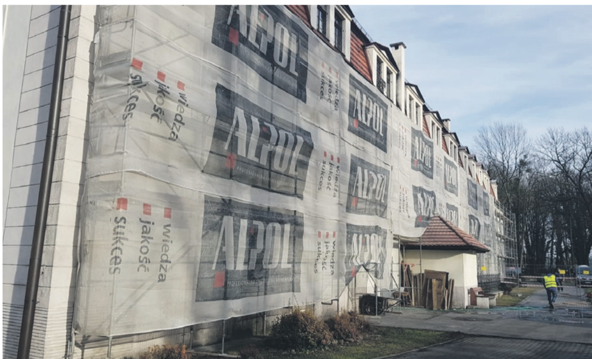
Ruszyły prace związane z termomodernizacją DPS w Szymiszowie

Właśnie rozpoczęła się największa inwestycja w Powiecie Strzeleckim. To od dawna zapowiadana i bardzo długo oczekiwana termomodernizacja budynku DPS w Szymiszowie.