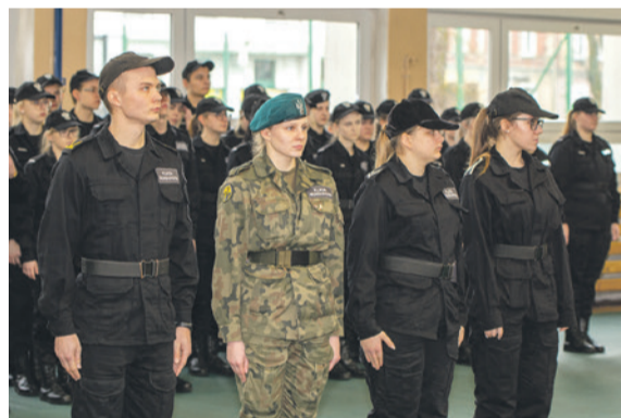
Uczniowie wszystkich klas mundurowych w CKZiU 3 marca otrzymali stopnie wojskowe