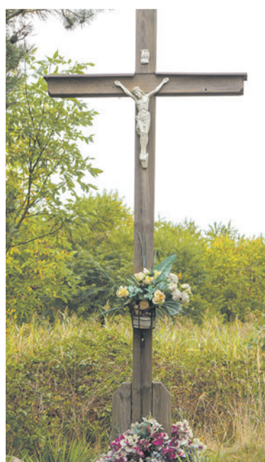
Borycz - Łysa Góra