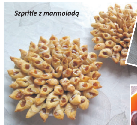
Szpritle z marmoladą