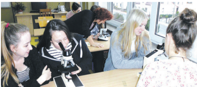
Liceum Ogólnokształcące im. Mieszka I w Zawadzkiem:

Zapraszamy zatem do podjęcia nauki w Zespole Szkół Ponadpodstawowych w Zawadzkiem. Dla ułatwienia decyzji podajemy kilka przydatnych informacji o możliwościach nauki w poszczególnych typach szkół oraz perspektywach zawodowych po skończeniu szkoły.