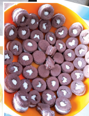
Krucze ciasteczka czekoladowe z masą z mleka w proszku