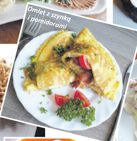
Omlet z szynką i pomidorami