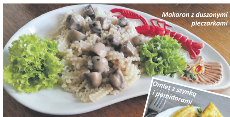
Makaron z duszonymi pieczarkami

Klasy gastronomiczne rozwijają swoje umiejętności realizując zdalne nauczanie w domu. Z przesłanych przepisów, filmików i prezentacji przyrządzają różnorodne smakołyki.