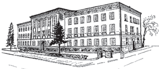
Szkoła z tradycją dla przyszłości