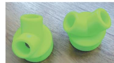
„Prześciółki” do masek i respiratorów