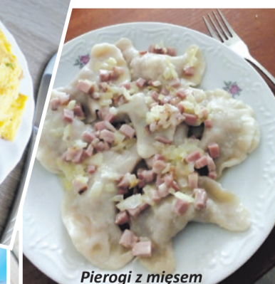
Pierogi z mięsem