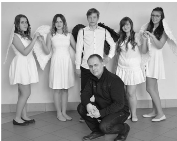
„Aniołki Maksymiliana” https://www.facebook.com/aniolkimaksa

Trzymajcie za nas kciuki! Postawcie na „THC” i „Aniołki Maksymiliana”! Polubcie nas na FB!