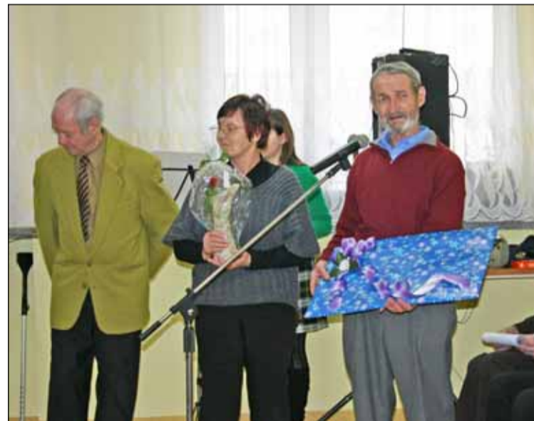
Z życzeniami pospieszyli również mieszkańcy DPS w Szymbarku i Leśnicy