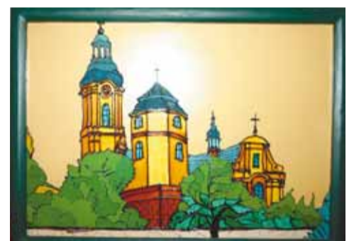
Taki obrazek na szkło malowany powstał w czasie zajęć warsztatowych

Grupa młodzieży z Zespołu Szkół Zawodowych nr 1 w Strzelcach Opolskich, działająca pod nazwą Grupa Elektromontaż zdobyła 1 miejsce i nagrodę GrandPrix Europejskiej Platformy Recyklingu S.A. w Ogólnopolskim Konkursie Ekologicznym „Drugie Życie Elektrośmieci”.