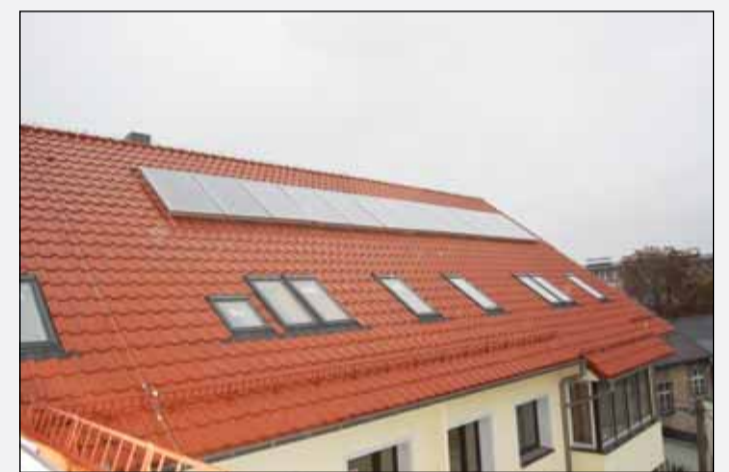
Słońce ogrzewa DPS