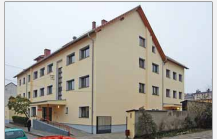
DPS dziś - rozbudowany o jedno skrzydło i podwyższony o jedną kondygnację