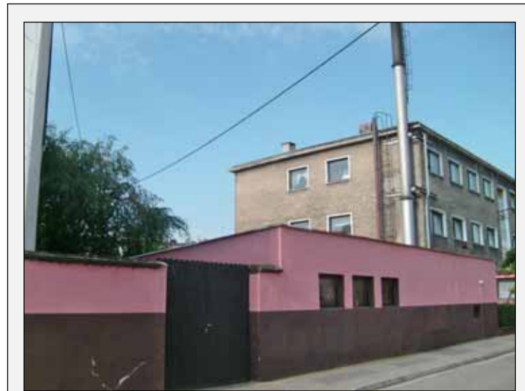
Tego komina już nie ma

Dziś strzelecki DPS wygląda zupełnie inaczej niż kilka lat temu – nie tylko z zewnątrz. Wyremontowane zostały korytarze, pokoje i sanitariaty, zainstalowano windę, wstawiono nowe meble; zmieniony został system ogrzewania i wentylacji. Stworzona została specjalna sala warsztatów, a w sali zabiegów rehabilitacyjnych pojawił się nowy sprzęt; jest też gabinet krioterapii. Zmiany można byłoby wyliczać jeszcze długo, trwały bowiem ponad trzy lata. Wszystkie inwestycje pochłonęły ponad 4,2 mln złotych (zestawienie prac w kolejnych latach publikujemy obok).