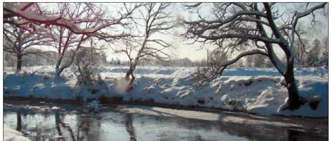
Mała Panew w zimowej scenerii