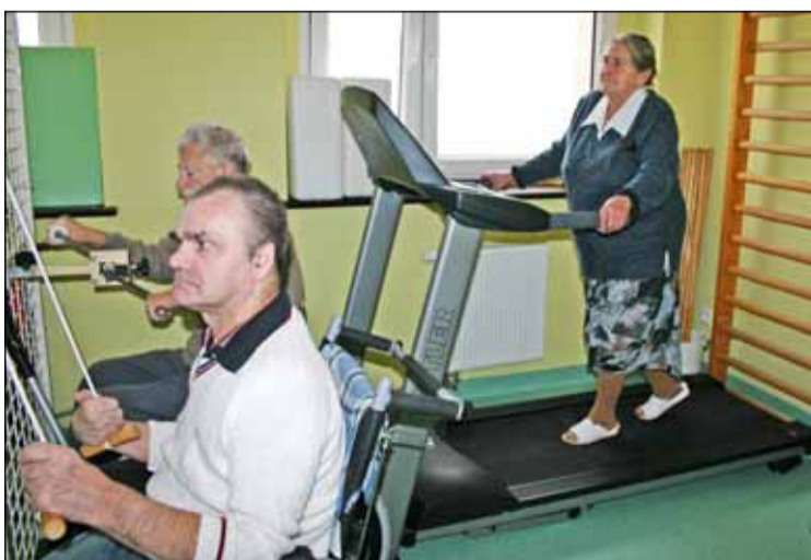
W gabinecie rehabilitacyjnym