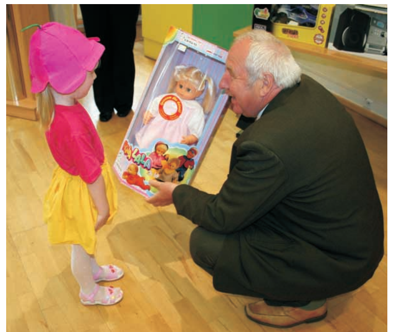
Taka mała, taki duży...