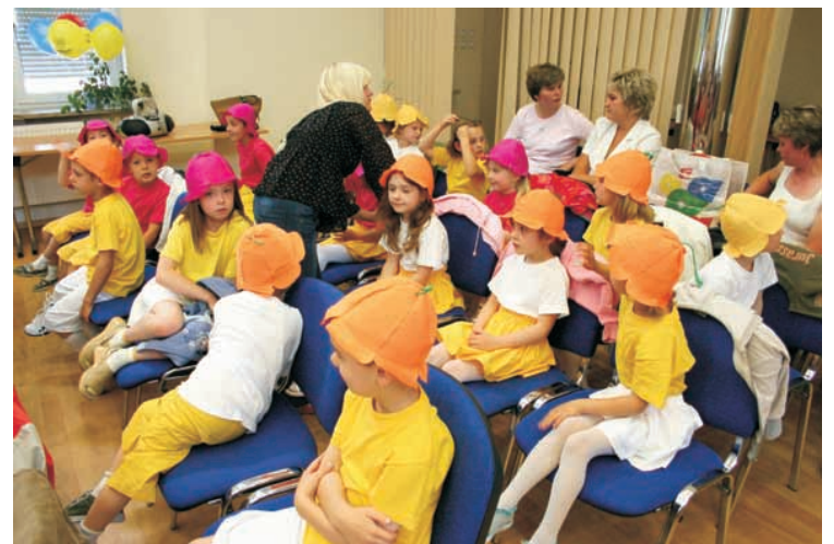
Kolorowe skrzaty czekają na werdykt