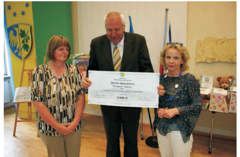
I nagroda dla przedszkola w Rożniątowie