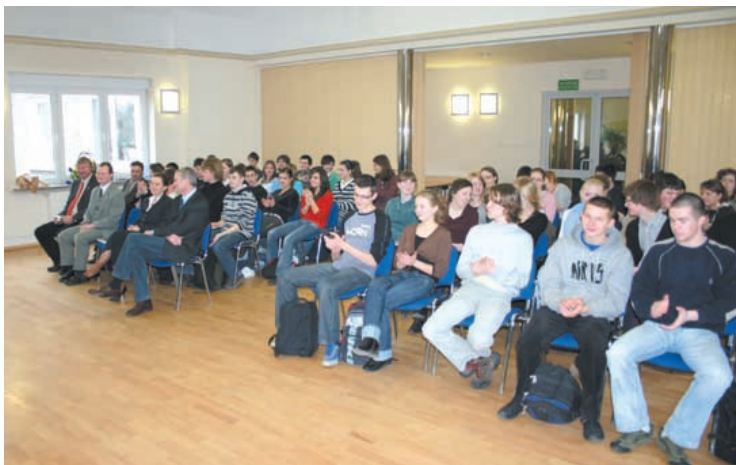
Międzynarodowe spotkanie w siedzibie strzeleckiego starostwa