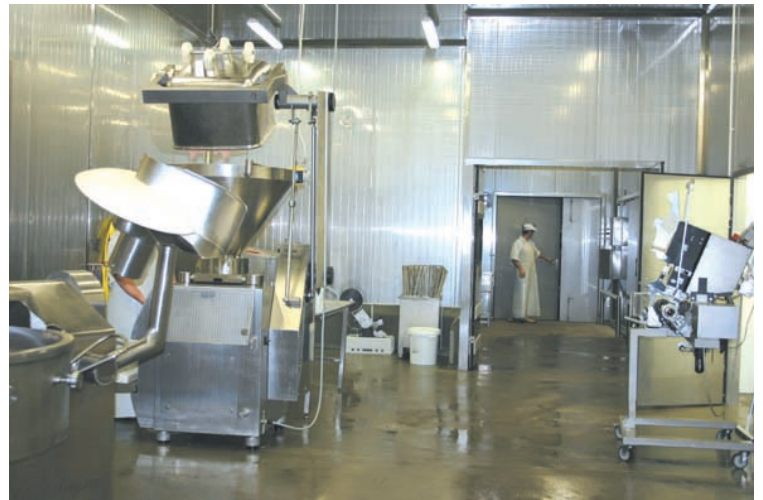
To tu produkuje się salami o smaku westfalskim

- Wyróżnienie cieszy, tym bardziej, że może przyczyni się do roz-