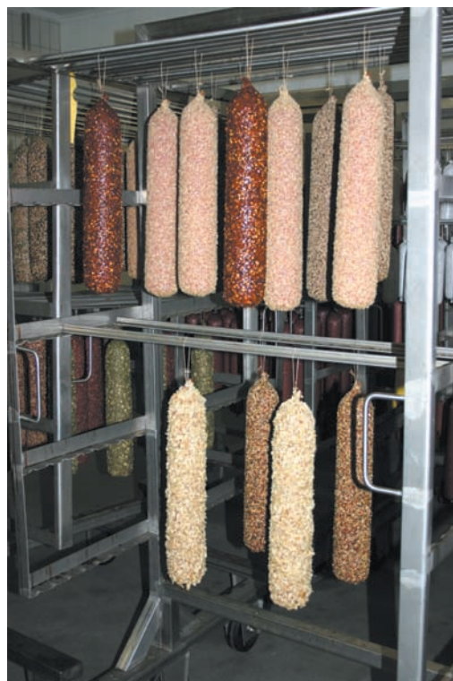
Jest w czym wybierać