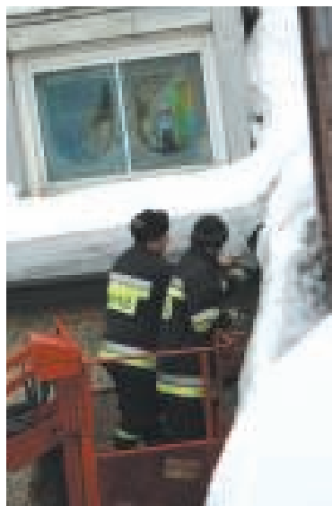
Lód w rynnach to także niemały problem

Trudno jednak stwierdzić, że dopiero to wpłynęło na podjęte działania w naszym powiecie. Dostrzegając realne zagrożenie związane z zalegającym śniegiem na dachach starosta już 3 stycznia br. wystąpił do kierowników powiatowych jednostek organizacyjnych z przypomnieniem o konieczności zrzucenia nadmiernej ilości śniegu z dachów budynków, szczególnie tych o płaskim zadaszaniu. Ostrzeżenie zostało poważnie potraktowane, ponieważ w obiektach, w których funkcjonują jednostki, na co dzień znajduje się duża liczba osób (Domy Pomocy Społecznej, szkoły ponadgimnazjalne, szkoły specjalne, itp.).