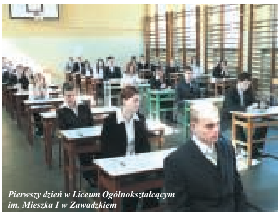
Pierwszy dzień w Liceum Ogólnokształcącym im. Mieszka I w Zawadzkim