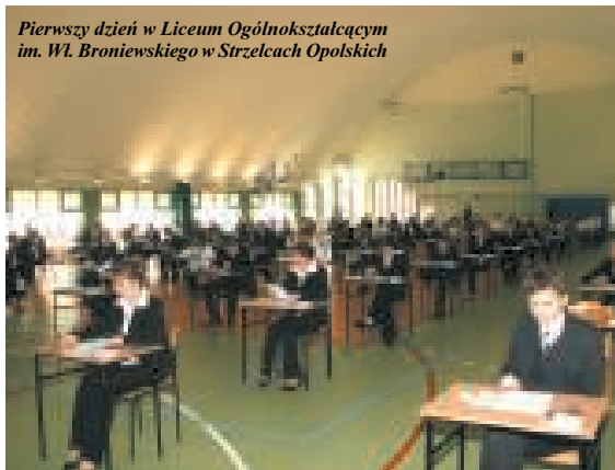
Pierwszy dzień w Liceum Ogólnokształcącym im. Wł. Broniewskiego w Strzelcach Opolskich

O pierwszych wrażeniach maturzystów - czytaj str. 5