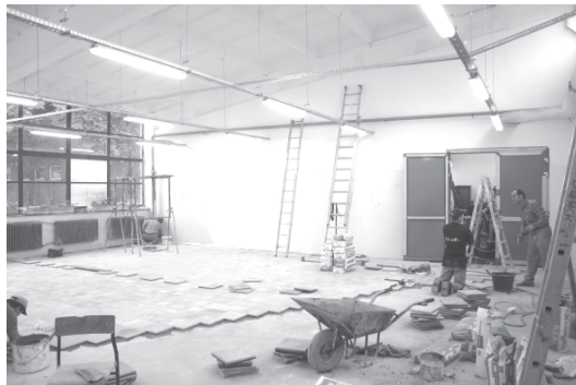
Sala gimnastyczna w ZSZ nr 1 - finisz

czyja powinna zapaść do końca sierpnia, więc poznamy ją w dniach. No i na koniec największa obecnie inwestycja edukacyjna – „Kompleksowa modernizacja systemu ciepłego