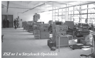
ZSZ nr 1 w Strzelcach Opolskich