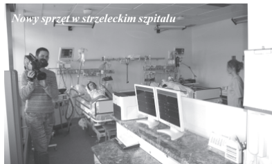
Nowy sprzęt w strzeleckim szpitalu