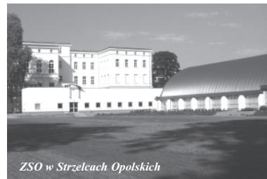
ZSO w Strzelcach Opolskich

Wyposażenie pracowni informatycznej, historycznej, mediateki Wartość zadania 48 141 w tym Fundacja Współpracy Polsko-Niemieckiej 20 tys. zł