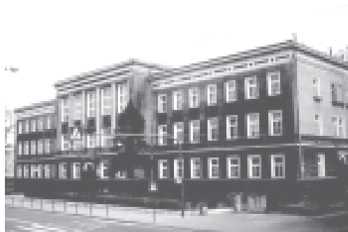
Budynek Zespołu Szkół wybudowany w 1871 roku; wygląd obecny

Zespół Szkół Ogólnokształcących w Strzelcach Op. jako szkoła z tradycją działa dla przyszłości pokoleń.