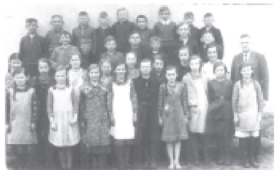
To zdjęcie przedstawia grupę uczniów z rocznika 1937/38. I tu mamy prośbę do naszych Czytelników: jeśli poznajecie Państwo kogoś – prosimy o podanie nazwisk.