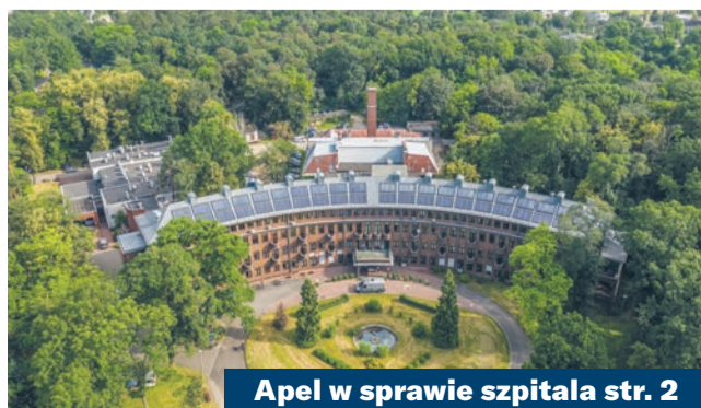
Apel w sprawie szpitala str. 2