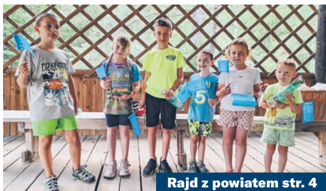
Rajd z powiatem str. 4