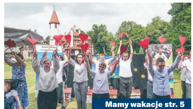
Mamy wakacje str. 5