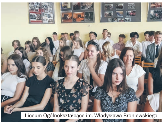
Liceum Ogólnokształcące im. Władysława Broniewskiego