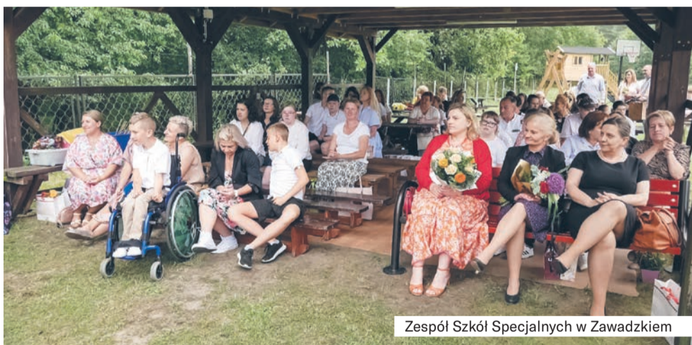
Zespół Szkół Specjalnych w Zawadzkiem