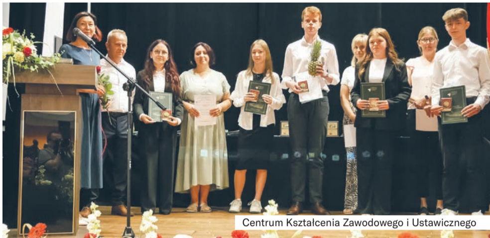
Centrum Kształcenia Zawodowego i Ustawicznego