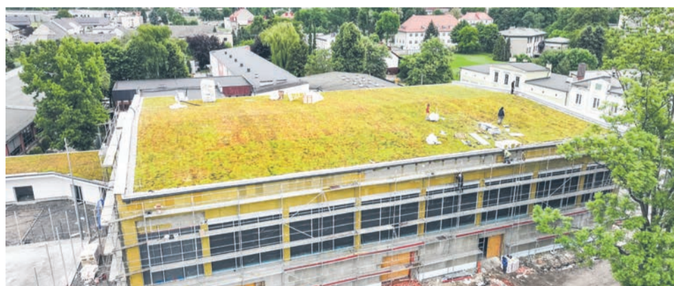
W zeszłym roku rozpoczęliśmy budowę hali pasywnej w Centrum Kształcenia Zawodowego i Ustawicznego w Strzelcach Opolskich.

Cały raport dostępny jest w Biuletynie Informacji Publicznej.