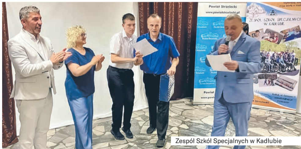
Zespół Szkół Specjalnych w Kadłubie