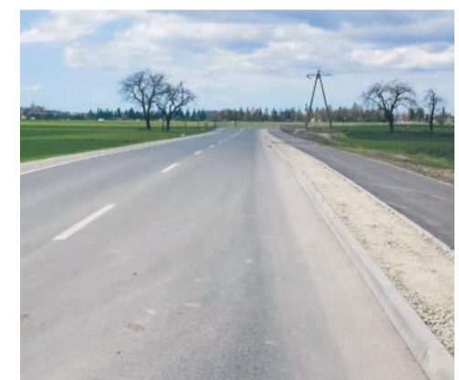
W 2024 roku wyremontowaliśmy m.in. drogę powiatową pomiędzy Leśnicą a Lichynią