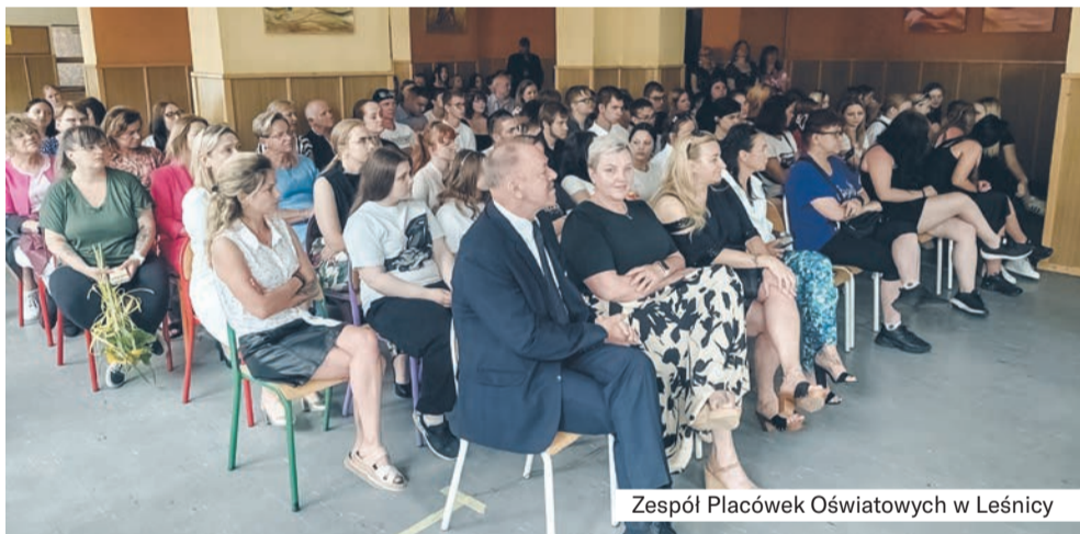
Zespół Placówek Oświatowych w Leśnicy