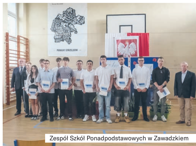
Zespół Szkół Ponadpodstawowych w Zawadzkiem