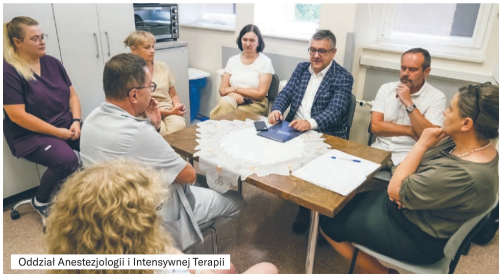
Oddział Anestezjologii i Intensywnej Terapii