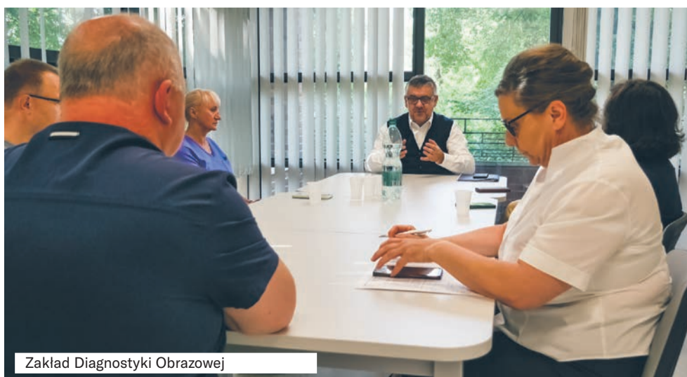
Zakład Diagnostyki Obrazowej