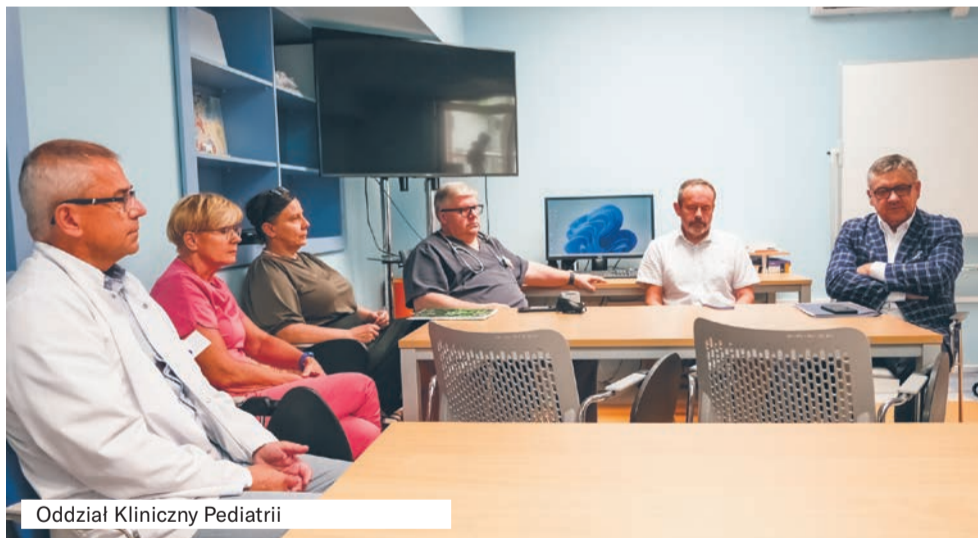
Oddział Kliniczny Pediatrii