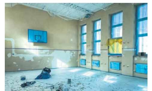
Wakacyjne remonty w naszych szkołach str. 4