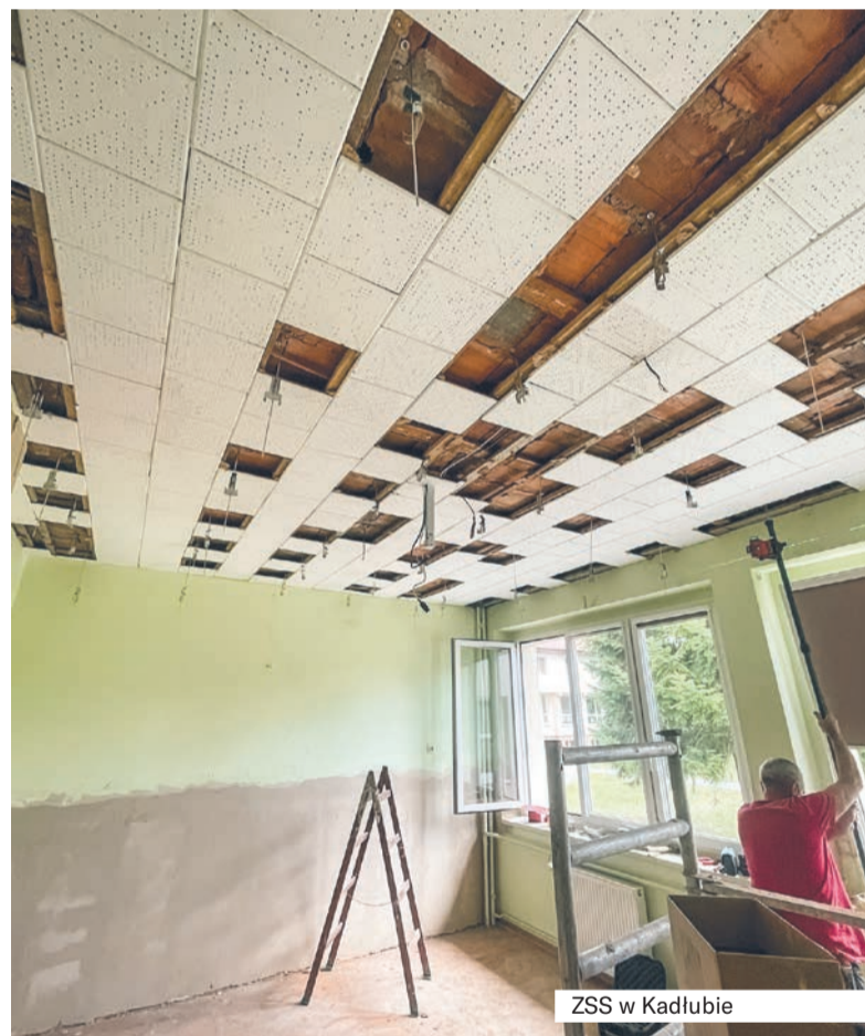
ZSS w Kadłubie

Łączny koszt zaplanowanych na wakacje prac to ponad 330 tys. zł. Wierzymy, że powrót uczniów do odświeżonych wnętrz sprawi, że nauka będzie jeszcze przyjemniejsza.