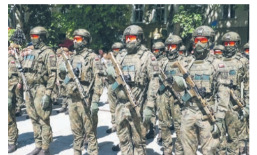
Uroczyste zakończenie Szkoły Legii Akademickiej str. 2