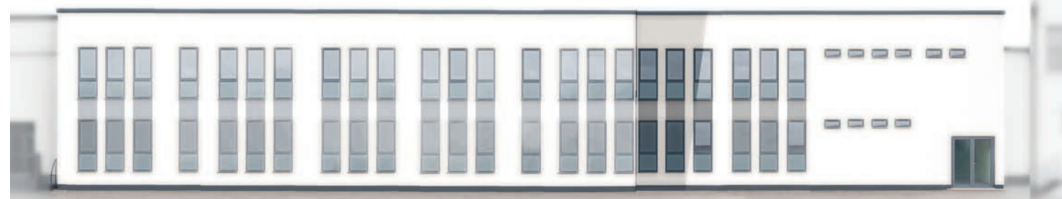
Wizualizacja elewacji frontowej BCU