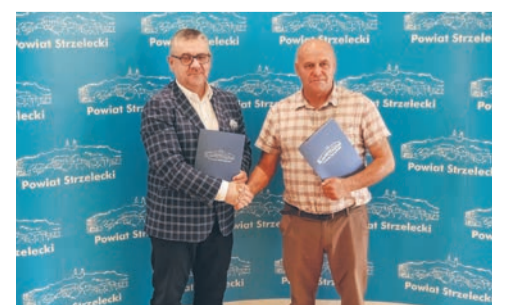
Ścieżka pieszo-rowerowa połączy Izbicko z Utratą str. 5