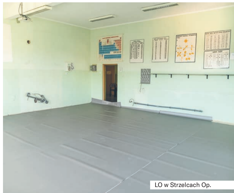
LO w Strzelcach Op.