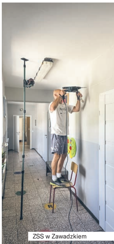
ZSS w Zawadzkiem