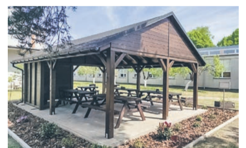
Ekologiczne inwestycje czekają ZPO w Leśnicy str. 4