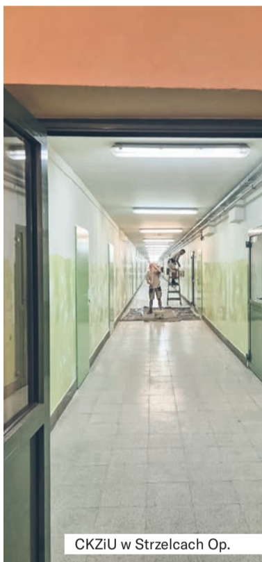
CKZiU w Strzelcach Op.

Z amiast dzwonka – odgłos Zwiertarki. Zamiast uczniów – ekipy budowlane. Wakacje nie oznaczają ciszy w naszych szkołach – to doskonały czas na przeprowadzenie niezbędnych remontów w placówkach oświatowych.