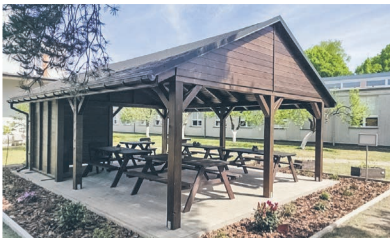
Podobna pracownia pod chmurką funkcjonuje już przy CKZiU w Strzelcach Opolskich

„ Ekoklasa ” zostanie urządzona w Zespole Placówek Oświatowych w Leśnicy. Dzięki dotacji 50 000 zł z programu WFOŚiGW w Opolu AKADEMIA MŁODEGO EKOLOGA powstanie wyjątkowa, kolorowa sala dydaktyczna pełna przyrodniczych inspiracji. Uczniowie klas I-III, a także starsze klasy: szkoła specjalna i szkoła branżowa, będą mogły uczyć się ekologii w ciekawy i angażujący sposób! Dotychczasowa klasa dydaktyczna