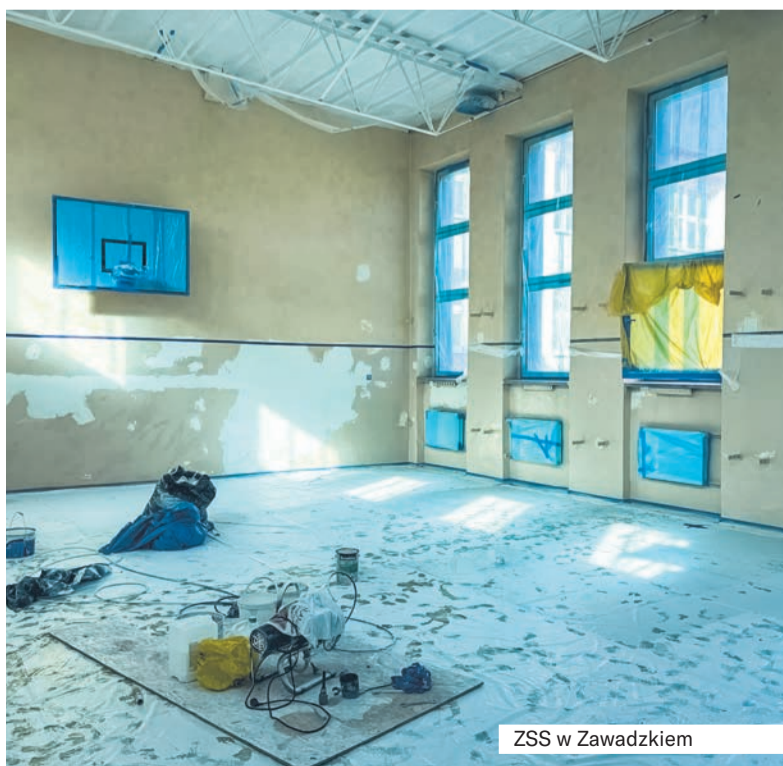
ZSS w Zawadzkiem