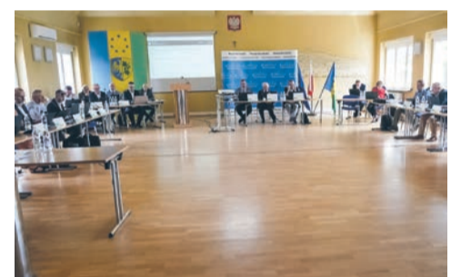
Sesja Rady Powiatu str. 2