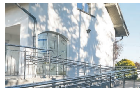
Rodzinny Dom Dziecka coraz bliżej otwarcia str. 4