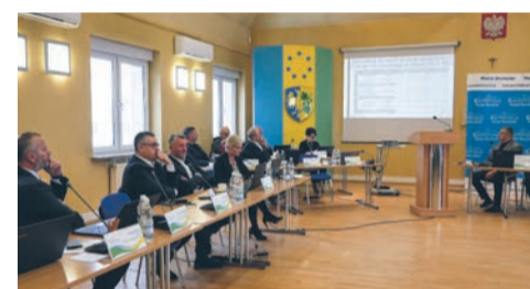
Sesja Rady Powiatu Strzeleckiego str. 2