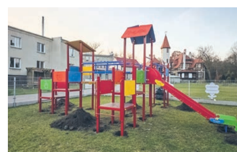
Powstaje nowy plac zabaw przy ZSS w Zawadzkiem str. 6