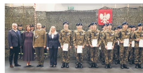
Nowi Kadeci już po ślubowaniu str. 5