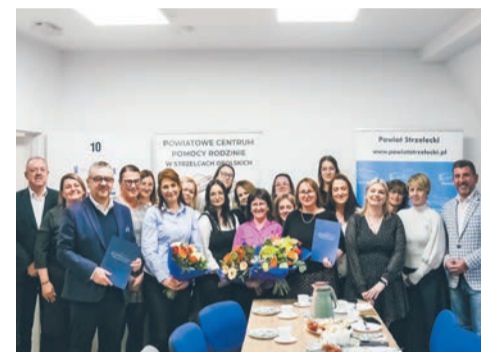
Dzień Pracownika Socjalnego str. 2