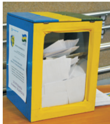
Nagrodę Konsumenta przyznano... Rozstrzygnięcie na Gali Lauri, 28 marca