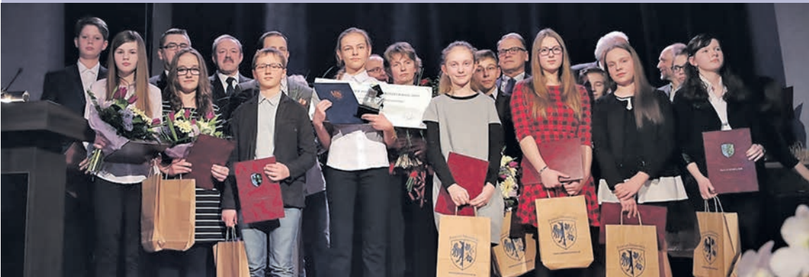
Wszyscy uczniowie nominowani w kategorii: „Najlepszy Uczeń Szkoły Podstawowej”