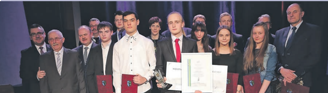
Wszyscy uczniowie nominowani w kategorii: „Najlepszy Uczeń Gimnazjum”