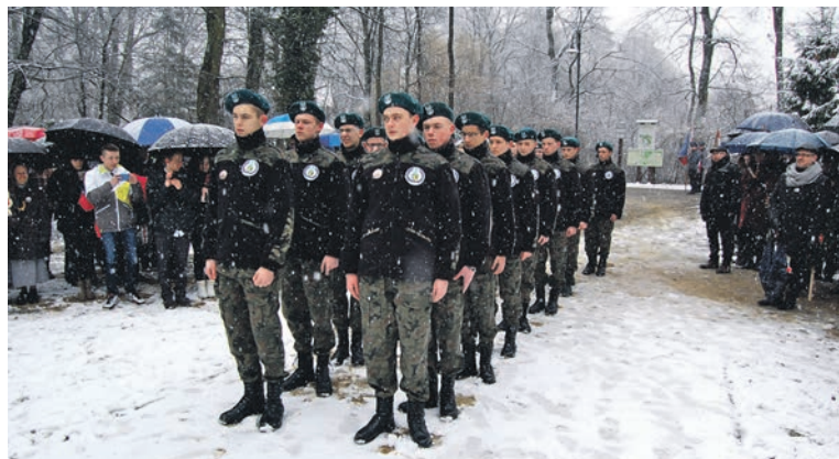
Uczniowie CKZiU w mundurach