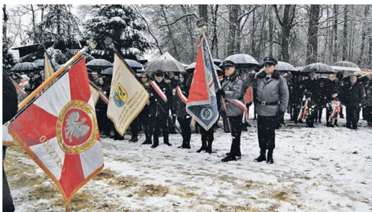
Poczet sztandarowy KPP w Strzelcach Opolskich