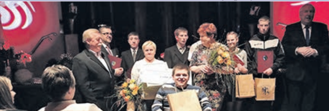
Wszyscy uczniowie nominowani w kategorii: „Najlepszy Uczeń - Bez Barier”