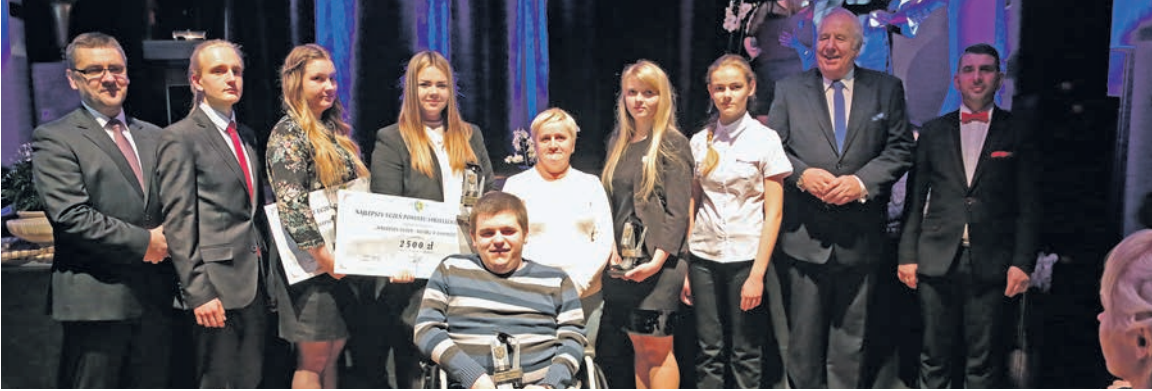
Pamiątkowe zdjęcie wszystkich Najlepszych Uczniów Powiatu w roku 2015.

To już 8 edycja Powiatowego Programu Wspierania Edukacji Uzdolnionych Dzieci i Młodzieży z terenu powiatu strzeleckiego, ustanowionego przez Radę Powiatu Strzeleckiego w 2008 roku. Ma on wymiar uniwersalny: honoruje zarówno osiągnięcia przedmiotowe, artystyczne, jak i sportowe uczniów, w tym również tych o specjalnych potrzebach edukacyjnych. Tytuł „Najlepszy Uczeń Powiatu Strzeleckiego” i nagroda finansowa – za osiągnięcia w poprzednim roku. Natomiast od dwóch lat formuła została poszerzona – o tytuł Mistrza w Zawodzie, by uhonoriować osiągnięcia uczniów ze szkół kształcących w kierunkach zawodowych. Poniżej przedstawiamy zwycięzców.