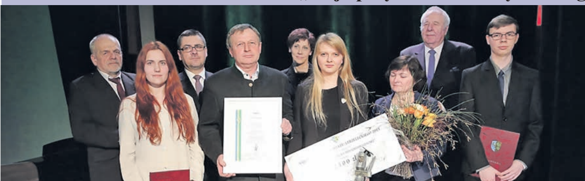
Wszyscy uczniowie nominowani w kategorii: „Najlepszy Uczeń Szkoły Ponadgimnazjalnej”