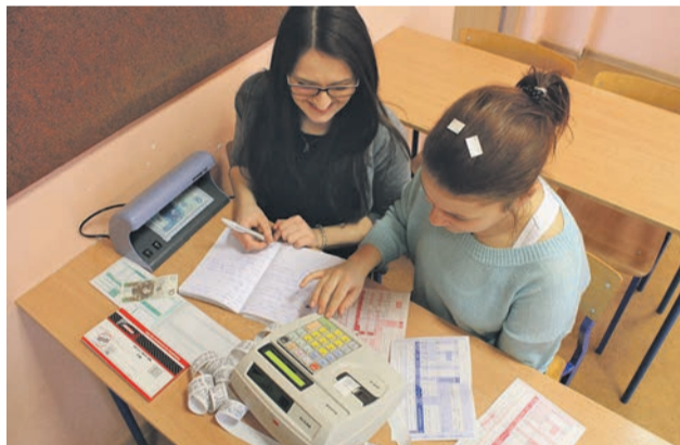
Z kasą fiskalną za pan brat