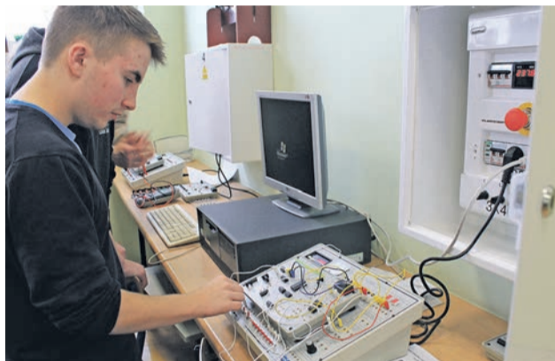
Jedna z najnowocześniejszych pracowni

Inne kursy – organizowane na zlecenie firm i instytucji oraz osób prywatnych.