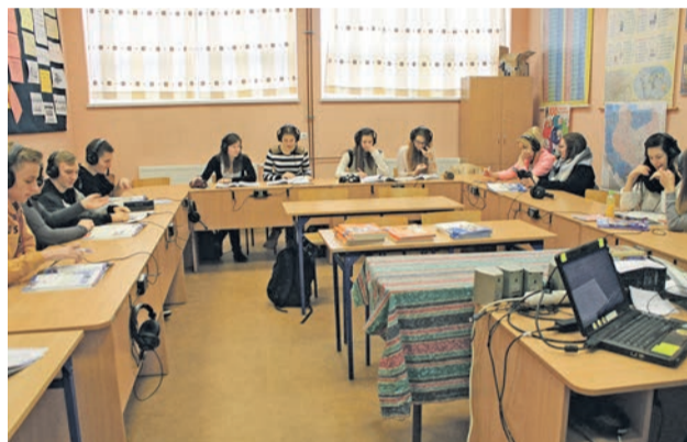
Pracownia języków obcych

Cykl kształcenia w ciągu 4 lat nauki obejmuje zajęcia teoretyczne, praktyczne i praktyki zawodowe w różnych hotelach w kraju jak i za granicą, dzięki którym uczniowie poznają specyfikę tego zawodu na różnych stanowiskach.