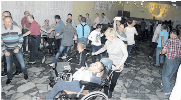
Wspaniała atmosfera panująca podczas zabawy, zaproszeni goście oraz kolorowe światła sprawiły, że zabawa była najlepsza z możliwych.