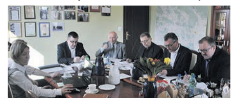
Nauczycielem Roku wybrano... Najlepszy Uczeń Powiatu Strzeleckiego to...