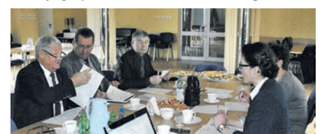
Najlepszy Produkt Powiatu Strzeleckiego 2016 to...