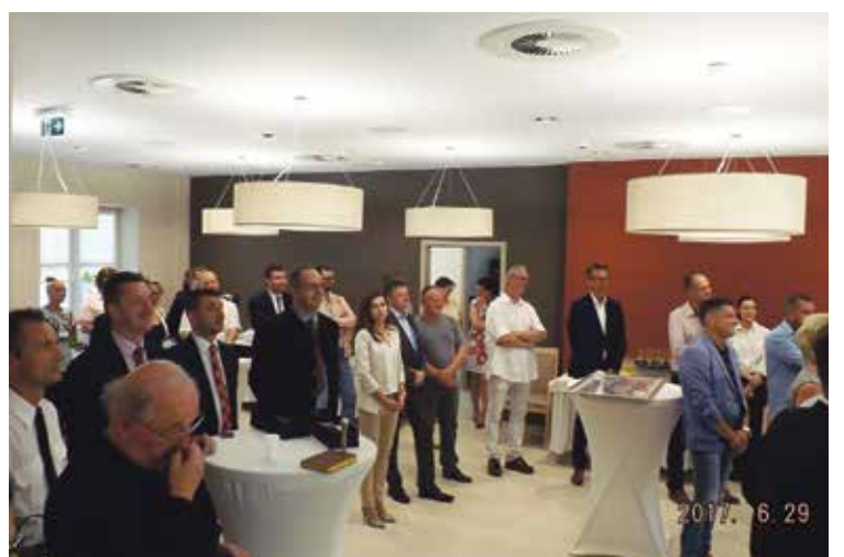
29 czerwca, otwarcie pierwszego prywatnego w powiecie strzeleckim DPS „Tiliam” w Zawadzkiem.