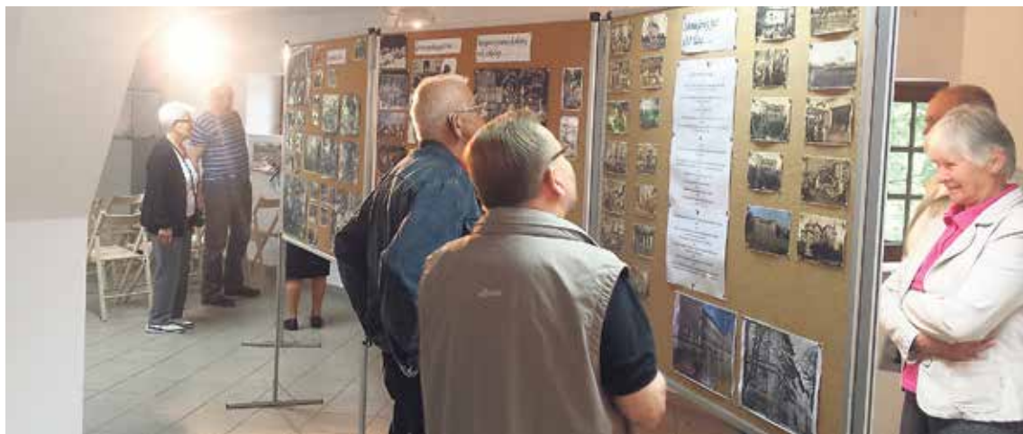
Foto-historia SOSW w Leśnicy