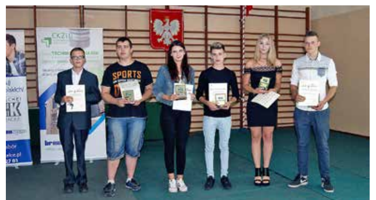
Absolwenci uhonorowani tytułami