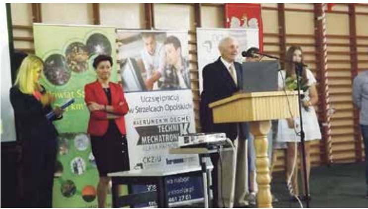
Po podpisaniu umowy stypendialnej z Kronospanem

Porozumienie z Politechniką Opolską, umowa stypendialna z Kronospanem, tytuły dla najlepszych absolwentów – tak wyglądał koniec roku w CKZiU