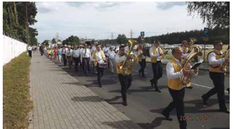
25 czerwca, rozpoczynają się dwudniowe obchody Dni Gminy Zawadzkie.