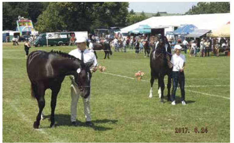
24 czerwca, Poręba – Regionalny Przegląd Koni Rasy Śląskiej