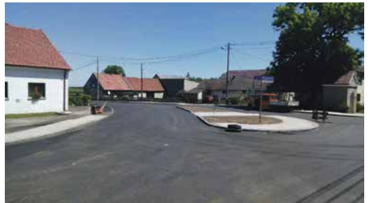
Dolna, inwestycja rozpoczęła się w kwietniu br. Zakończyła 15 lipca 2017 r., całkowity koszt zadania wyniósł ponad 1,2 miliona zł.

Dwie najważniejsze inwestycje drogowe Powiatu Strzeleckiego w roku 2017: