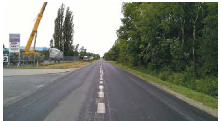
Ulica Zakładowa w Strzelcach Opolskich, inwestycja rozpoczęła się 3 lipca br., przewidywany termin zakończenia robót – połowa września 2017 r., całkowity koszt zadania – ponad 1,6 miliona zł.