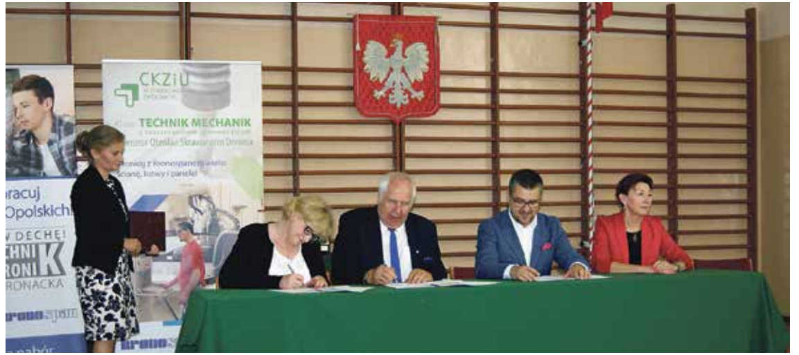
Podpisanie porozumienia z Politechniką Opolską

uczelnię zaplecza laboratoryjno-dydaktycznego CKZiU oraz promocji oferty Politechniki Opolskiej wśród młodzieży powiatu.