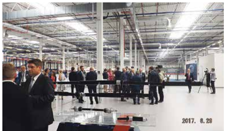
29 czerwca, otwarcie zakładu „IFA” w „naszej” części Katowickiej Specjalnej Strefy Ekonomicznej, czyli w Ujeździe. Firma IFA to jedno z największych na świecie przedsiębiorstw z branży motoryzacyjnej.