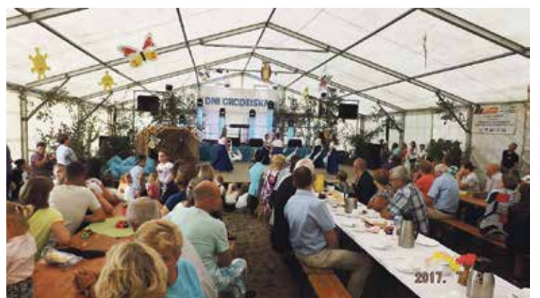
2 lipca, podczas Dni Grodziska zawsze jest przednia zabawa.